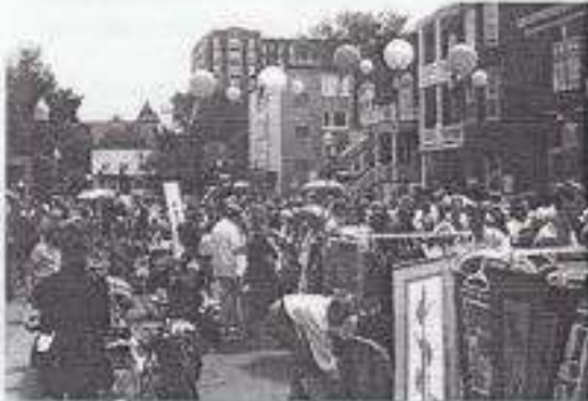
Belle journée et grand achalandage au marché de la rue Cartier.

Comme au dernier printemps, la ville a eu la bonne idée d'organiser un marché sur la rue Cartier (dommage qu'il ne se fait pas plus qu'une fois par été). Remis d'une semaine à cause du vent et de la pluie, les gens ont su bien profiter des beaux moments de soleil de la journée pour fouiller dans les vieilles porcelaines de grand-mère. Mais coin Cartier et Aberdeen une surprise entre 11 heures et midi : les plus courageux de l'Association Tango Québec ont trôné l'asphalte pour exhiber leur passion pour le tango. Et le printemps, finalement, semblait vouloir s'habiller en été.