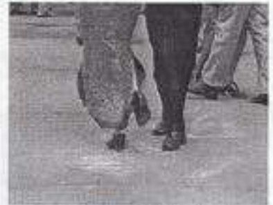
Les pieds des danseurs ont cherché avec tenacité les traces de talc saupoudré par le président.