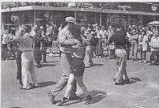
Les curieux regardent épatés les fous qui dansent de façon exotique sur le pavé.