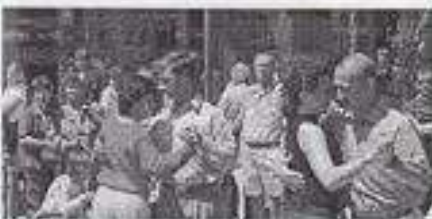
"On trouve de tout dans un marché aux puces" semblait penser le monsieur au fond.