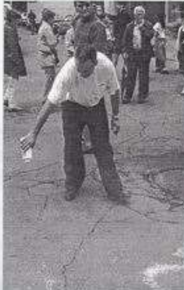
Grand effort du président de Tango Québec pour rendre le plancher dansable !