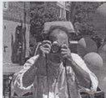
Medialuna fait son travail.

Endroit : rue Cartier ; date : 9 juin 2002 ; photographies : Daniel Skuk et Sylvain Marcotte.